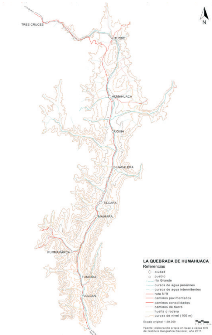
Figura 1: La Quebrada de Humahuaca

Durante los últimos años y fundamentalmente desde que fue declarada Patrimonio de la Humanidad, la bibliografía fue identificando algunos de los cambios desde la clave patrimonial (Paterlini, 2011) y desde las formas constructivas locales (Rotondaro, 2011); y otras notables transformaciones relacionadas también con los usos del suelo y el desarrollo