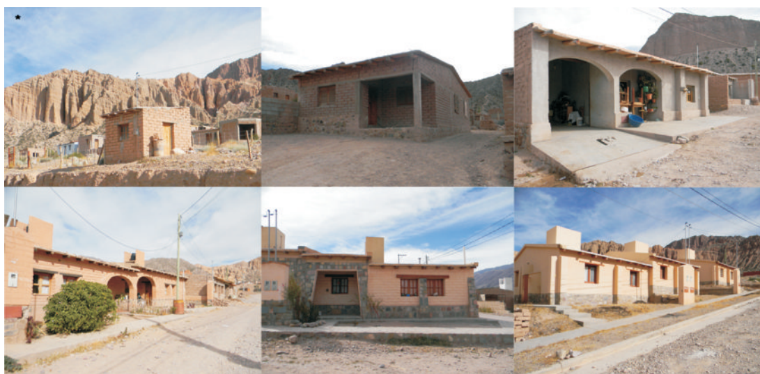
Figura 6: Las viviendas en Sumay Pacha.

Vemos que el interés "patrimonial" por el paisaje y al mismo tiempo la valoración del adobe desde sus capacidades constructivas y como forma de recuperar tradiciones locales de la población que se plasma en el acta de acuerdo que firmaron los vecinos se reproduce también en las políticas del Estado. Pero si bien