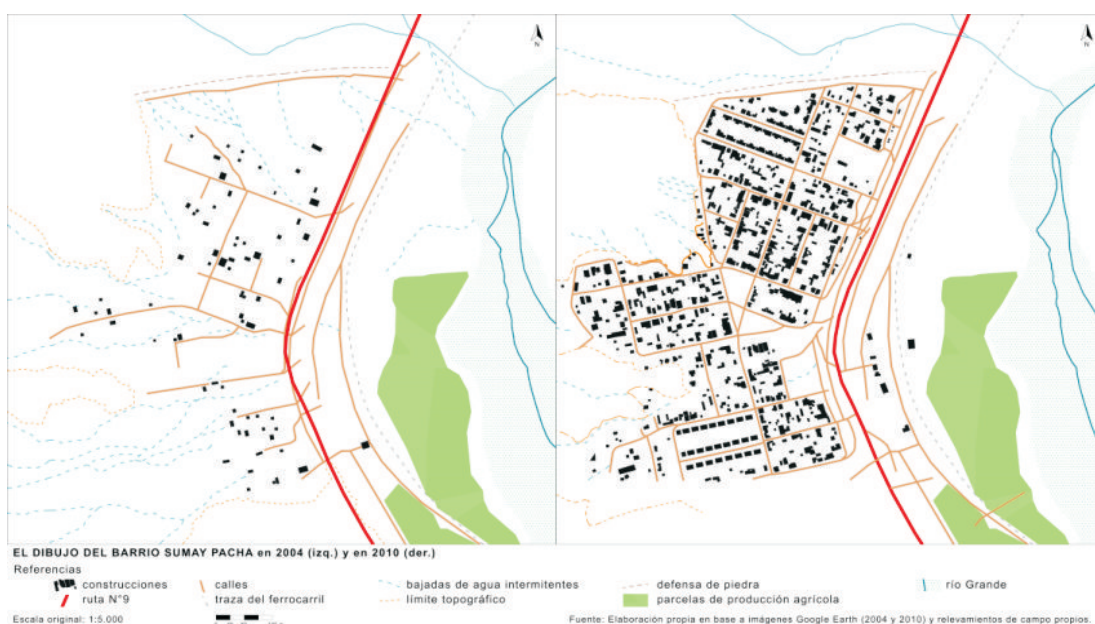
Figura 4: El dibujo de Sumay Pacha. Elaboración propia.

Los lotes se fueron entregando desde la Municipalidad de Tilcara a los futuros ocupantes, según el plano de loteo realizado y pocos meses después ya había más de una veintena de familias que habían comenzado a construir su casa y ya la estaban “challando” (palabra de uso local que designa un ritual de bendición). No nos atrevemos a decir que fue un “loteo público” o “fiscal” porque el plano en el que se basó no estaba aprobado por la autoridad competente en esta materia que en la Provincia de Jujuy es la Dirección General de Inmuebles. Sin embargo, el plano fue tomado por la Municipalidad de Tilcara y por los habitantes como el plano “oficial” del barrio. Sobre la base de este plano se realizaron los proyectos de viviendas de interés social. Con lo cual sin ser entonces legal, llegó a ser el oficial y sobre esos lineamientos “técnicos” se construyó el territorio.