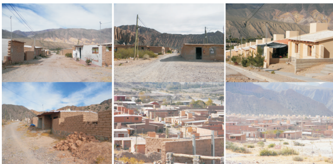
Figura 5: Fotografías de Sumay Pacha.

La casa autoconstruida es el tipo de construcción que más se repite (fig. 6 foto *). Son edificaciones conformadas por un cubo pequeño (en general no mayor de 5 m x 5 m),